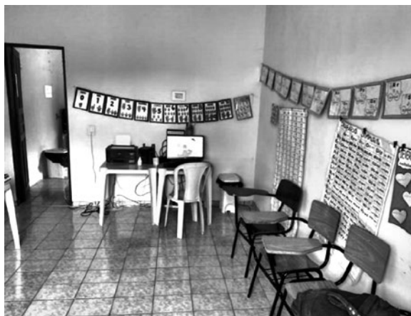
Imagem 2 – Sala de atendimento educacional especializado (Libras)

Assim, as aulas passaram a ser lecionadas nas salas da catequese, a partir de 9 de maio de 2022. Diante desse contexto, entendendo que a infraestrutura e a organização administrativa foram levadas para o espaço cedido pela igreja, vamos chamá-lo de “Escola”. Apresentamos, a seguir, algumas imagens dos espaços de catequese da igreja transformados em salas de aula, refeitório e banheiros usados pelos estudantes e professores como espaço escolar.