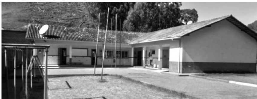
Imagem 1 – EMPEF São Rafael

O espaço físico, em linhas gerais, atende às demandas dos alunos e dos professores, considerando a realidade de outros estabelecimentos rurais. A escola possui três salas de aula, uma biblioteca pequena (utilizada para o atendimento educacional especializado no contraturno à escolarização dos estudantes com deficiência), um banheiro acessível para usuários de cadeiras de rodas e outros banheiros para estudantes (masculino e feminino), uma cozinha, uma despensa, uma área de serviço, um depósito para material de limpeza, uma sala para professores com banheiro, um depósito para material didático e um pátio amplo, como podemos observar na imagem a seguir.