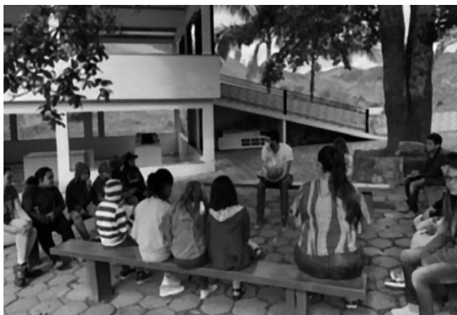
Imagem 11 — Roda de conversa sobre o planeta Terra no pátio da igreja