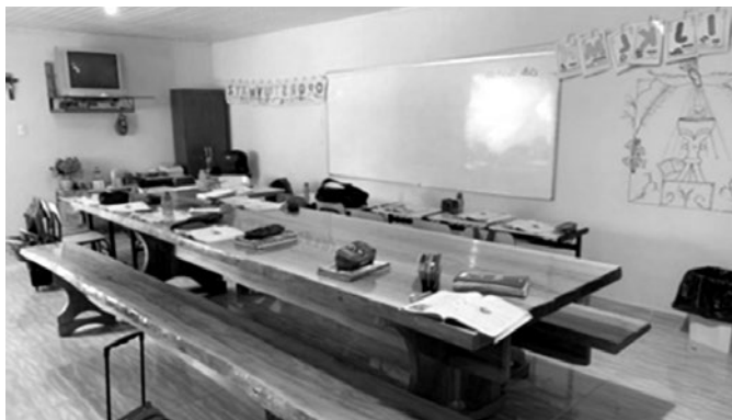
Imagem 3 – Sala de aula do 3º ao 5º ano