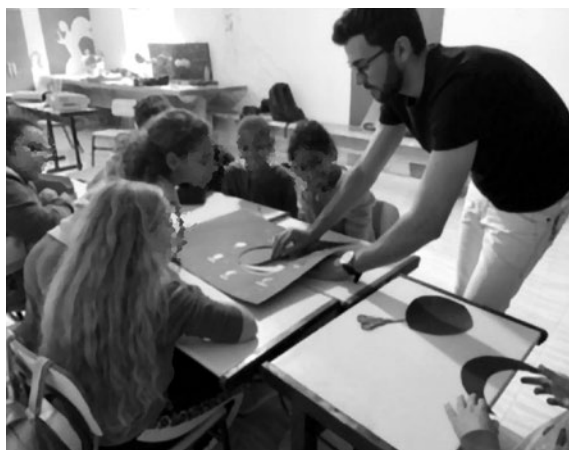
Imagem 20 — Atividade sobre as fases da Lua