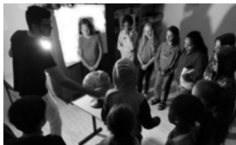
Imagem 18 — Explicação sobre os movimentos de rotação e translação da Lua