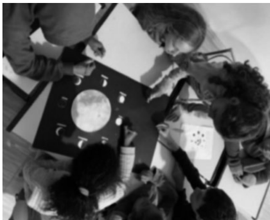
Imagem 19 — Atividade sobre as fases da Lua