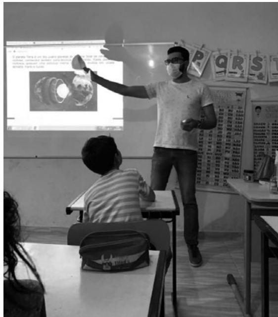
Imagem 12 — Apresentação do conteúdo

A seguir, apresentamos a organização da aula e a execução das atividades