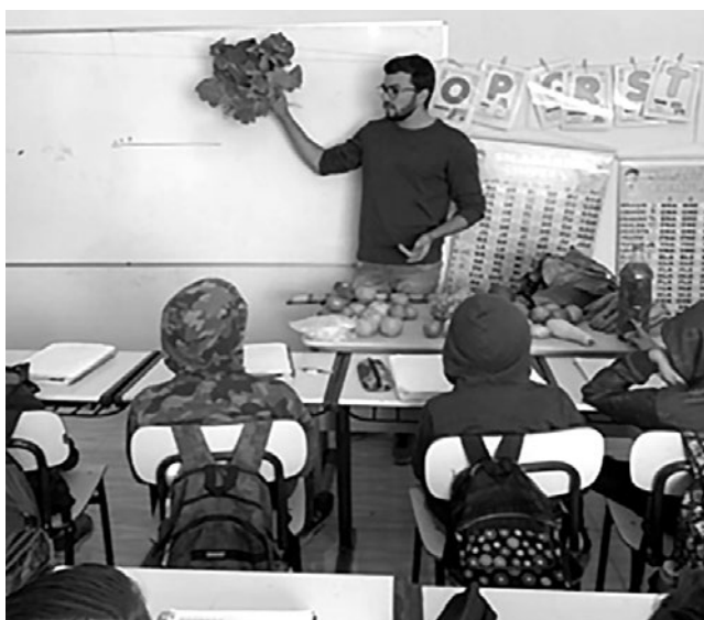
Imagem 7 — Atividade sobre os alimentos produzidos