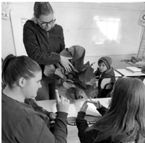
Imagem 8 — Atividade sobre os alimentos produzidos