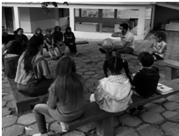
Imagem 10 — Roda de conversa sobre o planeta Terra no pátio da igreja