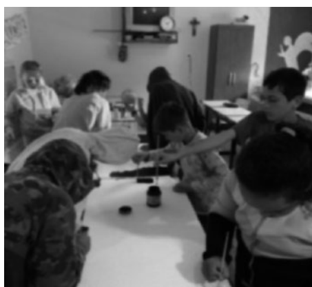
Imagem 14 — Confecção da maquete sobre o sistema solar

As imagens a seguir apresentam as práticas desenvolvidas com os estudantes e a maquete finalizada.