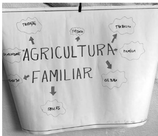
Imagem 5 – Atividade realizada pela estudante Maria