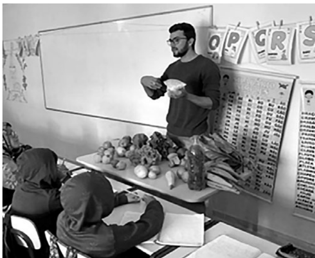
Imagem 6 — Atividade sobre os alimentos produzidos