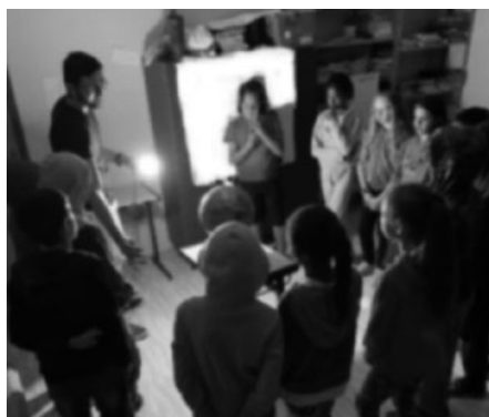
Imagem 17 — Explicação sobre os movimentos de rotação e translação da Lua

Realizado esse momento de leitura, apresentamos dois vídeos sobre o assunto. O primeiro tratava das fases da Lua com uma explicação científica. O segundo abordava as influências da Lua sobre a agricultura. Os estudos realizados nos permitiram mediar práticas pedagógicas para explicar os movimentos de rotação e translação como observamos nas imagens a seguir.