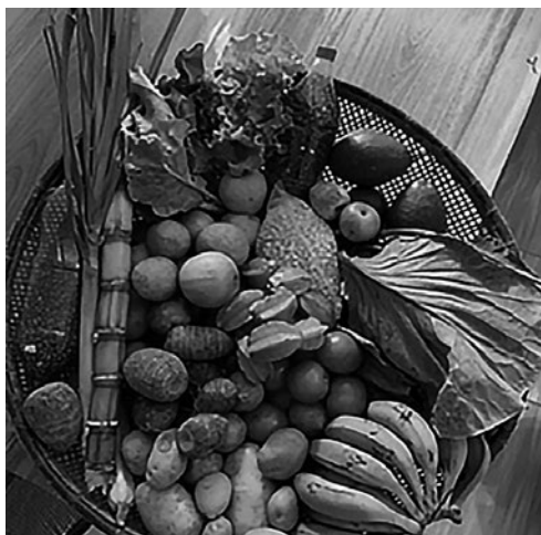
Imagem 9 — Atividade sobre os alimentos produzidos