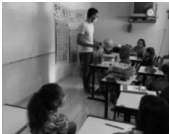
Imagem 13 — Apresentação do conteúdo